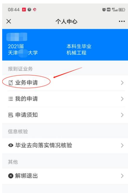
图 3 学生端发起图例

(3) 在提交时务必勾选正确的“办理业务类型”、上传派遣事项对应的相关证明材料。上报成功后，等待学校审核