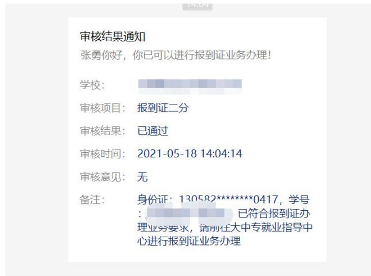
图 5 学生收到的反馈信息