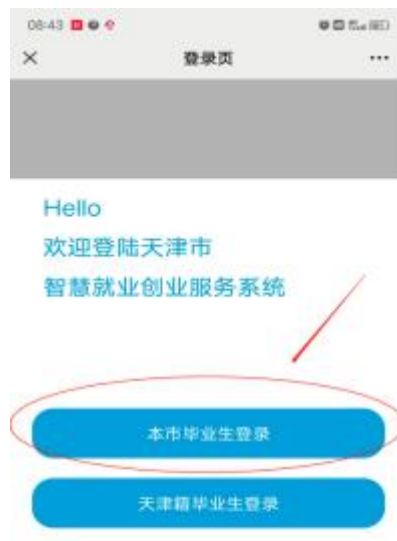
图 2 毕业生登陆界面